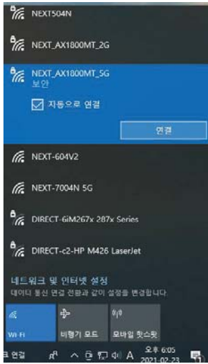
[그림. 무선 신호 목록 창 화면]

4. [NEXT-AX1800MT] 무선 신호 이름(SSID)을 선택하여 자동으로 연결 체크 후 [연결]클릭합니다.